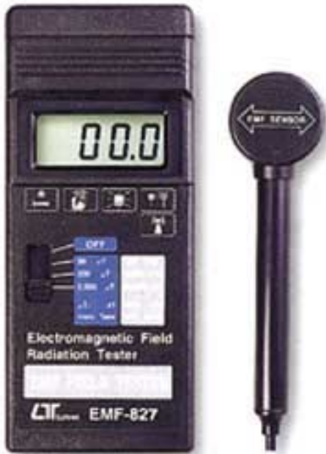
EMF-827 EMF Electromagnetic Field radiation tester

Giovedì 06 Ottobre 2011 15:33 - Ultimo aggiornamento Martedì 13 Agosto 2019 07:43