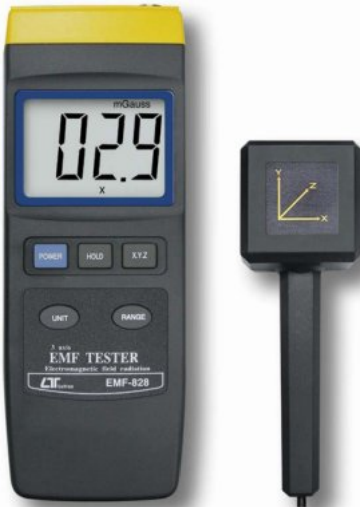
EMF-828 di campo magnetico a bassa frequenza (30-300 Hz) con sensore triassiale